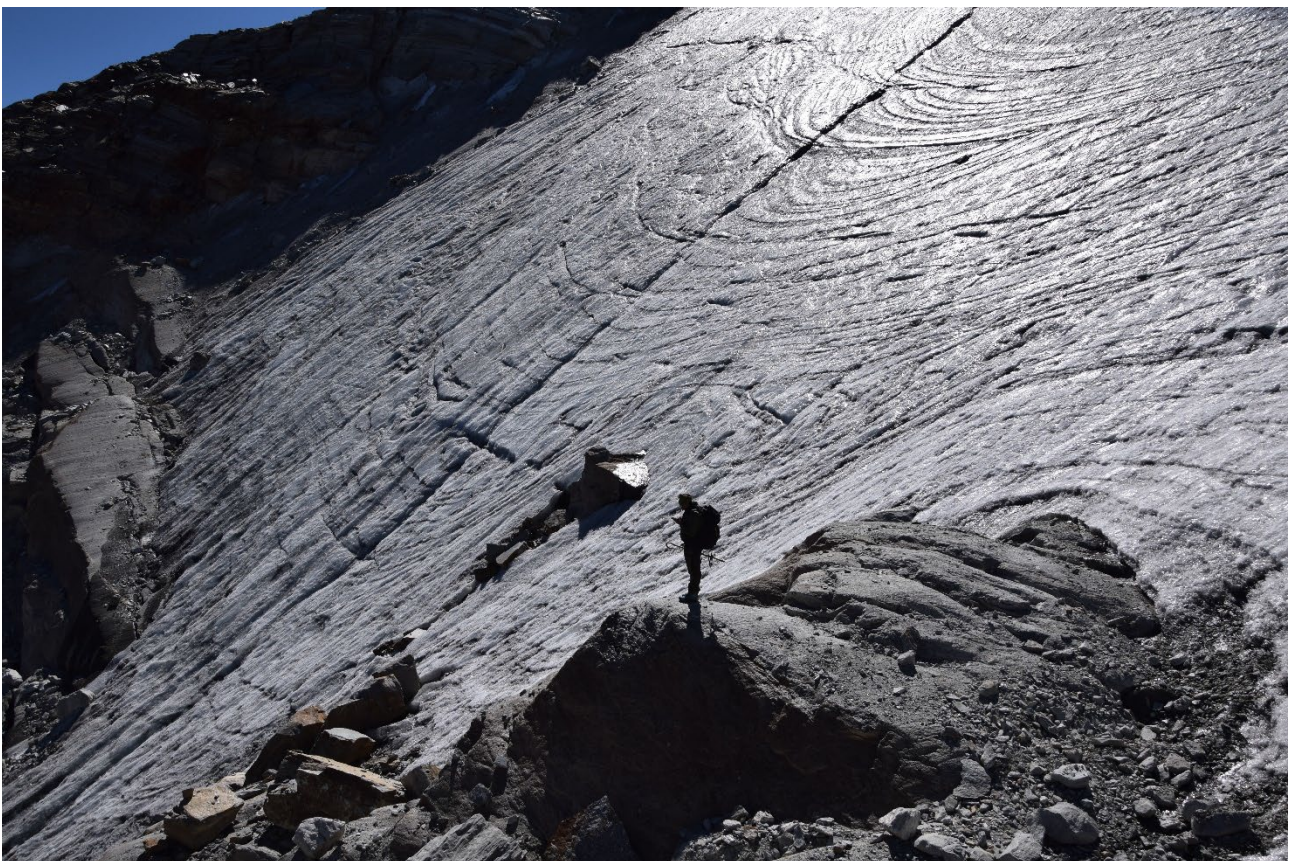
20 settembre 2022